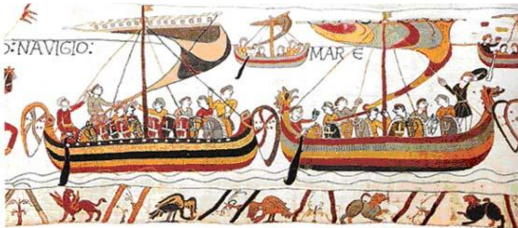
La flotta di Guglielmo salpa per l'Inghilterra