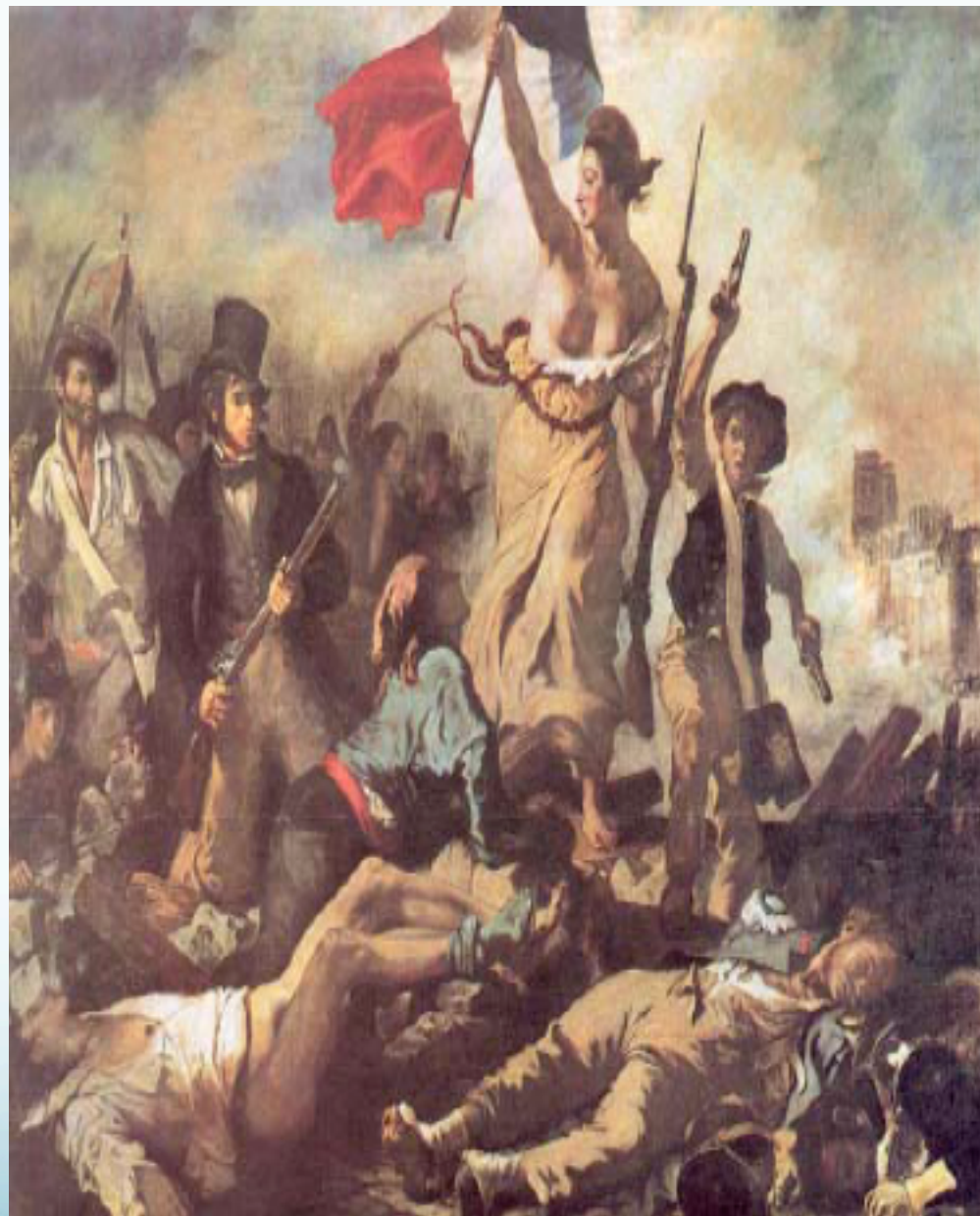
Eugene Delacroix La libertà guida il popolo