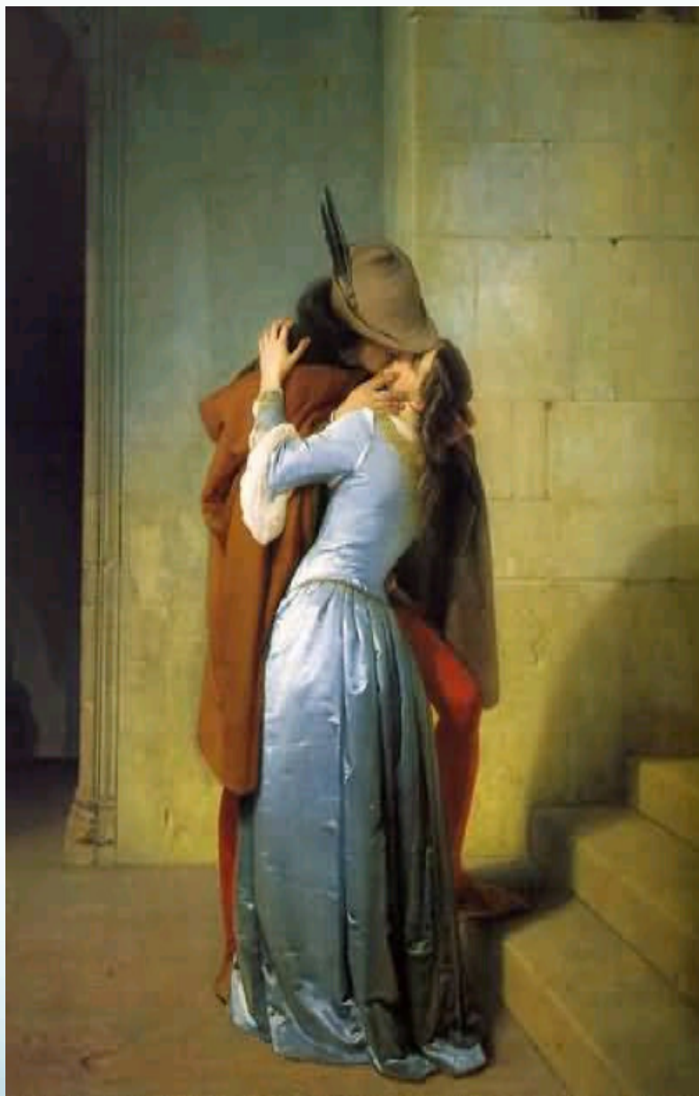
Hayez Il bacio